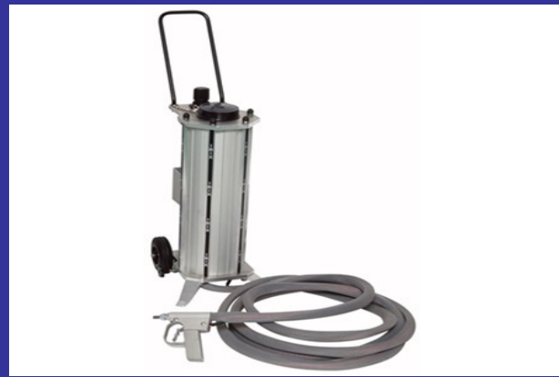
Compact en handig in gebruik