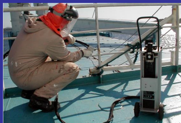
Moeilijk bereikbare plaatsen stralen